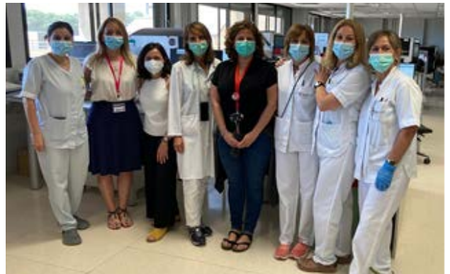
Part de l'equip del laboratori

“ Al nostre centre estem molt sensibilitzats amb el programa de donació de sang de cordó. Treballem en equip i ens agrada molt buscar contínuament com millorar el seguiment de l'embaràs i la informació que se li dona a la gestant. Estem convençuts que aquesta és imprescindible per tal que les gestants estiguin tranquil·les i per tant puguin entendre i decidir sobre la possibilitat de ser donants.